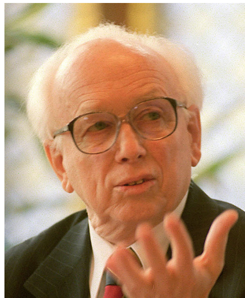
Mádl Ferenc volt köztársasági elnök

Az itt mutatkozó út, a bölcs és elkötelezett politika célhoz vezethet. Elsősorban azért, mert nem a pusztá megmaradás, nem önmagában egy válság túlélésének egyébként rendkívül fontos feladata határozza meg ezt az utat és politikát, hanem az, ami azon túl van: egy olyan Magyarország fölépítése, amelyikre a nemzet büszke lehet, amelyikben állam és polgára nem egymás ellenére akar sikeres lenni.