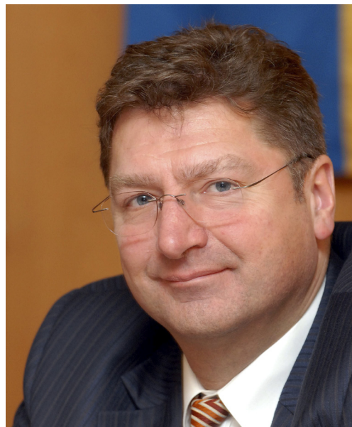
Parragh László a Magyar Kereskedelmi és Iparkamara elnöke

Erős és hiteles kormányra van szüksége a gazdaságnak. Olyanra, amely képes meghozni s végrehajtani a szükséges döntéseket. Olyanra, amelyben bíznak a nemzetközi pénzügyek. Olyanra, amely elég erővel bír ahhoz, hogy letörje a túlburjánzott bürokráciát, valamint a korrupciót. Olyanra, amely az ország szűkös erőforrásait prioritások mentén koncentrálni képes új munkahelyek létrehozására. Olyanra, amely csökkenti a vállalkozások terheit s képes átstrukturálni az adórendszert. Olyanra, amely figyelembe veszi a közgazdaságtan realitását s érti a feladatát!