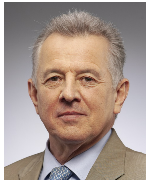
Schmitt Pál az Európai Parlament alelnöke

Életem minden napja valahogy mindig Magyarországhoz köt, az ünnepek és a hétköznapok is, örömmel, bánatukkal, sikereikkel és akár a balsorssal is. Ahhoz, hogy ünnepeinket valódi hazaszeretetünk értékei töltsék meg, keményen kell dolgoznunk, a mindennapjainkban rejlő lehetőségeket meg kell ragadnunk. Ez a hétköznapok hazaszeretete, amire egyre nagyobb szüksége van Magyarországnak. A hétköznapok szorgalmas családjaira, amelyekben mindenki lehetősége szerint a lehető legtöbbet teszi: anyaként otthon, gyermekként tanulva az iskolában, családfenntartóként munkahelyén szakmája legjavát nyújtva. Ki fiatalos lendülettel kreatívan, ki megfontoltan, bölcsen, lépésről lépésre. Ahol mindenki számára nyitott és belátható új távlatok nyílnak, ahol szeretik és nagyra becsülik az anyanyelvüket, ügyelnek testi-lelki egészségükre, ahol értékek mentén szerveződő közösségek adják egy-egy település és a haza mindennapi erejét.