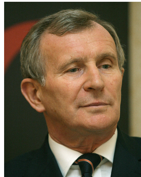
Járai Zsigmond korábbi MNB-elnök, pénzügyminiszter

A gazdasági növekedés kulcskérdései a közeljövőben nem a további elhibázott megszorításokban, hanem a beruházások, a vállalkozások számára kedvező gazdasági környezet megteremtésében, az új munkahelyek létrehozásának segítségével és a modern gazdaság igényeinek megfelelő oktatás kialakításában lesznek. A magyar vállalkozások versenyképességének fellendítését kell szolgálnia az alacsonyabb adókulcsokkal működő, sokkal egyszerűbb adórendszernek, a szükséges szolgáltatások nyújtását szem előtt tartó, a felesleges bürokráciát megszüntető államigazgatásnak és a közélet tisztaságát javító korrupciócsökkentésnek. A stabil gazdasági növekedés elérését és fenntartását célozva új alapokra kell helyezni a költségvetési és a jegybanki politikát, a bankok és a pénzügyintézetek működését. A szükséges változtatásokkal egy-két év alatt megteremthetők a gazdasági növekedés feltételei, 2-3 év alatt pedig elérhető a lehetséges növekedés évi 4-5 százalékra történő emelése.