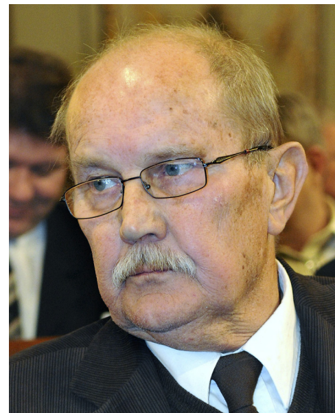
Makovecz Imre Kossuth-díjas építész

A nemzeti ügyek számomra azt jelentik, hogy a nemzet érdekeit érvényesítjük minden területen. A nemzetnek érdeke, hogy legyenek jó iparosai, akik jó minőségű szolgáltatásokra képesek, ebből az következik, hogy nemzeti érdek az, hogy ezeknek a tevékenységeknek az adó- és járulékterheit radikálisan csökkentse a kormányzat. Ugyanakkor az ellenőrzést nyilván szigorítani szükséges. Nemzeti érdek, hogy a hazai cégek ne adózzanak többet, mint a külföldiek.